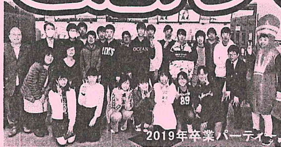
2019年卒業パーティー